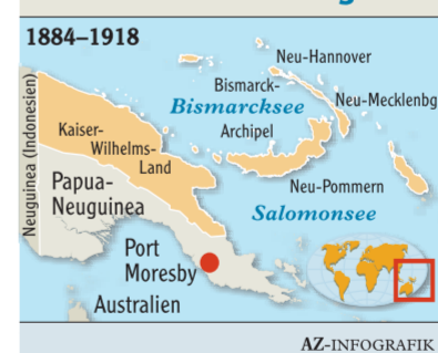
In der Inselwelt der Südsee hatte das Deutsche Reich eine Kolonie.