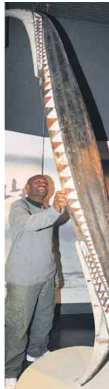
Kultische Bedeutung haben die Figuren, die im neuen Museum in Obergünzburg zu sehen sind. Links eine Uli-Figur – ein Häuptling, der Aggressivität, Männlichkeit und Weiblichkeit zugleich verkörpert, in der Mitte eine wehrhafte Tatanua-Maske, rechts Betu Watas, ein Gast von der Pazifik-Insel Pentecost mit einem Kanu.